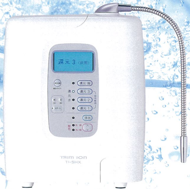
電解還元水整水器 TRIM ION TI-5HX 管理医療機器製造販売認証番号：219AGBZX00020000